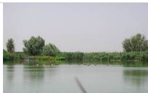
Anse Vallive di Portomaggiore