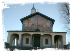
Santuario di Monserrato (Borgo S. Dalmaso)